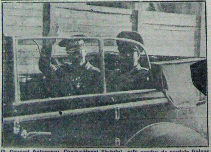
D. General Antonescu, Cducătorul Statului, este condus de contele Galeazzo Ciano, ministrul Afacerilor Straine al Italiei la reședința 'Villa Madama' de pe Monte Mario