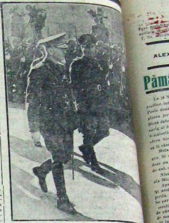
Cducătorul Statului și Ducele fascismului trec în vizită în piața gării Termini în orașul Roma detașându-se de onoare al regimentului de grenadierii Nr. 2

MOSCOVA, 19 (I. p.). — Postul de radiodifuziune din Moscova subliniază un articol apărut în ziarul 'New-York Times' în care corespondentul său militar, d. Baldwin, declară printre altele, analizând poziția Angliei: Dominația pe mare a Angliei nu o putea fi asigurată prin preluarea de vase auxiliare de război americane. Spre sfârșitul ultimului războiu mondial Anglia, alături de enorma sa flotă de război, a primit și ajutorul flotei de război americane, franceze, italiene și japoneze, și cu toate acestea ea nu a fost în stare să asigure dominația pe mare decât în ultimele luni a războiului.